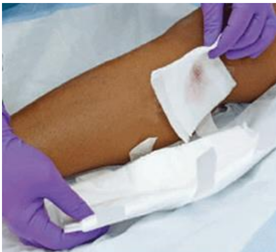
Figure. Removing the soiled dressing

Picturing wound cleaning ਜਖਮ ਸਾਫ ਕਰਨ ਦੀਆਂ ਤਸਵੀਰਾਂ